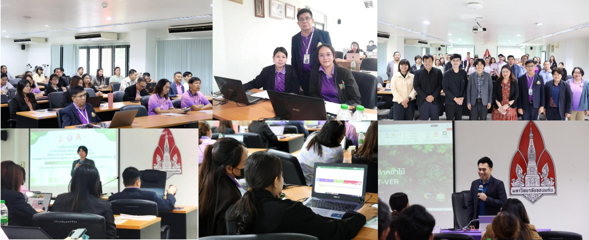
วันที่ 28-29 สิงหาคม 2568 คณะทำงานโครงการ อพสร. เข้าร่วมฝึกอบรมโครงการจัดกิจกรรมการใช้ประโยชน์จากข้อมูลทรัพยากรท้องถิ่นเพื่อช่วยลดและชดเชยการปล่อยคาร์บอนจนเป็นกลาง เครือข่าย อพสร.อีสานตอนบน ณ มหาวิทยาลัยขอนแก่น