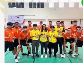
ชนิดกีฬา : ตะกร้อทีมชุด (ชาย)