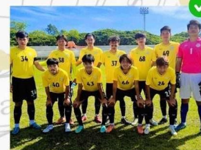
ชนิดกีฬา : ฟุตบอล (ชาย)