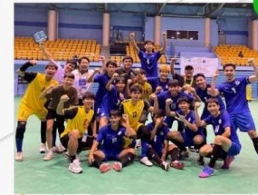
ชนิดกีฬา : ฟุตซอล (ชาย)

สรุปผลการแข่งขันของนักกีฬาวิทยาลัยบัณฑิตเอเชีย ที่เข้าร่วมการแข่งขันกีฬามหาวิทยาลัยครั้งที่ 50 (รอบคัดเลือก) ณ มหาวิทยาลัยเทคโนโลยีสุรนารี จ.นครราชสีมา