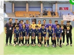
ชนิดกีฬา : ฟุตซอล (หญิง)