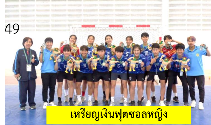
เหรียญเงินฟุตซอลหญิง