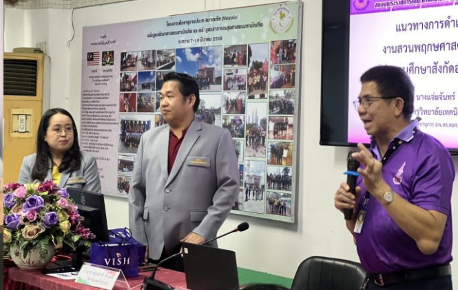
วันที่ 13 กุมภาพันธ์ 2567 จัดอบรม แนวทางการดำเนินงานสวนพฤกษศาสตร์โรงเรียน โดยวิทยากรจากวิทยาลัยเทคนิคชุมแพ จ.ขอนแก่น