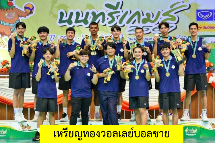
เหรียญทองวอลเลย์บอลชาย