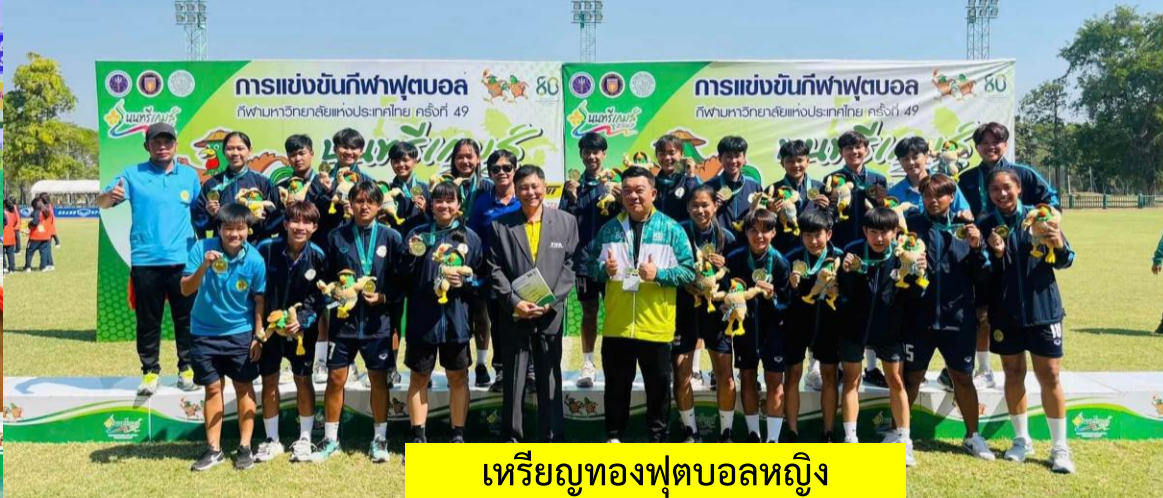
เหรียญทองฟุตบอลหญิง