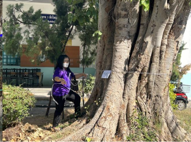
วันที่ 27 ธันวาคม 2566 กรรมการ อพ.สร.โครงการสำรวจต้นไม้และพิกัดต้นไม้ ณ ที่ตั้ง อ.เมือง